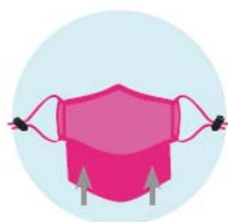
INSERIRE IL FILTRO