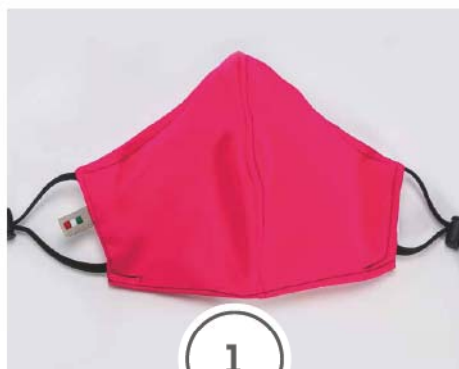
MASCHERINA FILTRANTE, ECOLOGICA, LAVABILE E REGOLABILE

TESSUTO | COTONE CERTIFICATO OEKO-TEX STANDARD 100 COMPOSIZIONE | COTONE 100%