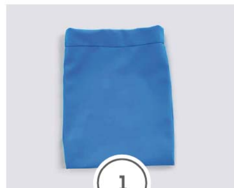
SACCHETTO PORTA MASCHERINA